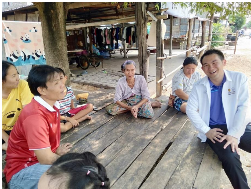
ภาพประกอบ การเยี่ยมบ้านนักเรียน

การนิเทศติดตามการวัดและประเมินผลของสถานศึกษาซึ่งเป็นการขับเคลื่อนการจัดการระบบการดูแลช่วยเหลือนักเรียนโรงเรียนหนองแขวงสุวรรณราษฎร์รังสรรค์ ไม่ใช่อะไรศึกษาได้มีการออกเยี่ยมบ้านนักเรียนประจำปีเพื่อจัดทำฐานข้อมูลของนักเรียนเป็นรายบุคคลและใช้เป็นฐานข้อมูลในการช่วยป้องกันและแก้ไขปัญหาต่างๆได้ในดั่งนั้นโรงเรียนจึงเล็งเห็นความสำคัญในการนิเทศติดตามและวัดประเมินผล